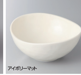
アイボリーマット

133-49-77H 750円 片口すり鉢(大) 13.5×12×5cm 133-50-77H 660円 片口すり鉢(中) 12×10.2×5cm 133-51-77H 480円 片口すり鉢(小) 9.7×8.6×3.7cm