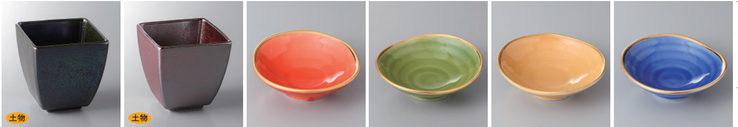
137-1-5H 1,120円 鳳凰角小付 6.4×6.4×6.4cm 137-2-5H 1,120円 飛鳥角小付 6.4×6.4×6.4cm 137-3-93H 1,150円 有田焼 四袖金小付(赤) 5入 10×3cm 137-4-93H 1,150円 有田焼 四袖金小付(緑) 5入 10×3cm 137-5-93H 1,150円 有田焼 四袖金小付(黄) 5入 10×3cm 137-6-93H 1,150円 有田焼 四袖金小付(青) 5入 10×3cm