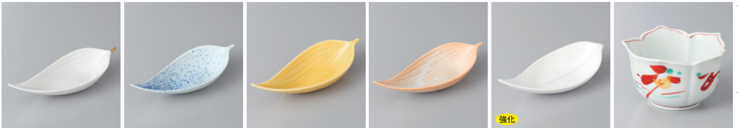
137-19-2H 1,100円 白金笹型小付 15×6×3.3cm 137-20-00H 1,250円 吹墨笹型小付 15×6×3.3cm 137-21-00H 1,200円 黄笹型小付 15×6×3.3cm 137-22-00H 970円 志野笹型小付 15×6×3.3cm 137-23-77H 950円 白マツ笹型小付(小) 15×6.1×4.2cm 137-24-1H 1,100円 手描赤絵桔梗型 3.3小鉢 8.5×5cm