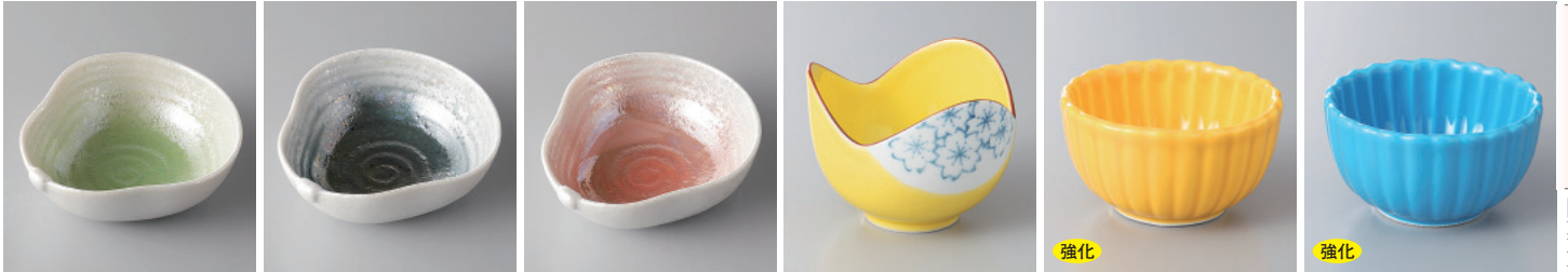
137-7-77H 1,100円 ヒロ吹きラスターひさご珍味 9.5×8.8×3.5cm 137-8-77H 1,100円 ゴス吹きラスターひさご珍味 9.5×8.8×3.5cm 137-9-77H 1,100円 ピンク吹きラスターひさご珍味 9.5×8.8×3.5cm 137-10-93H 1,100円 有田焼 黄さくら小付 10入 7×5.5cm 137-11-79H 1,100円 黄菊型 2.8小付 7.7×4.3cm 137-12-79H 1,100円 トロコ菊型 2.8小付 7.7×4.3cm