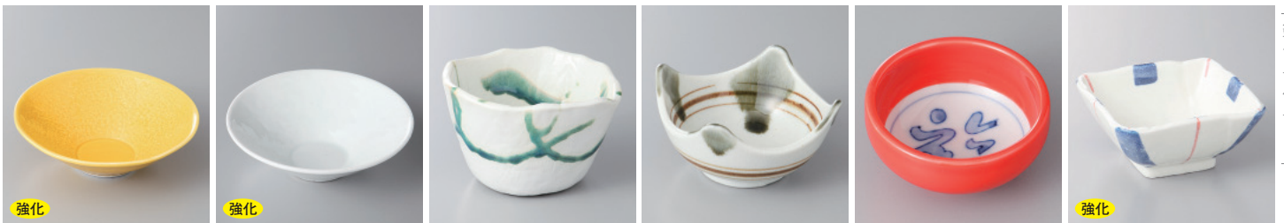
137-25-79H 1,000円 黄石目型丸小鉢(大) 11.3×3.5cm 137-26-79H 720円 黄石目型丸小鉢(小) 8.5×3cm 137-27-79H 980円 白磁石目型丸小鉢(大) 11.3×3.5cm 137-28-79H 680円 白磁石目型丸小鉢(小) 8.5×3cm 137-29-22H 1,000円 白マツ織部流小付 9.2×5.5cm 137-30-23H 1,000円 和モダン3.0四方鉢 8.5×8.5×4.7cm 137-31-22H 1,000円 柿釉福丸珍味 8.8×4.3cm 137-32-79H 1,080円 呉須ライン淡雪角小鉢 9×9×4.3cm