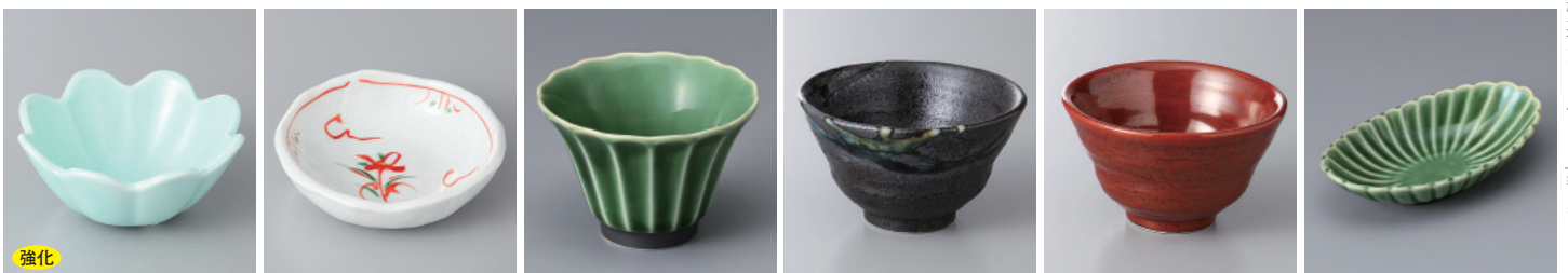
137-33-31H 1,050円 翡翠(強化)菊割小付 8.8×3.9cm 137-34-27H 1,050円 朱呉須花絵豆皿 9.3×9.3×2.7cm 137-35-23H 950円 菊型緑釉深小鉢 8×5.5cm 137-36-23H 950円 ビードロライン3.0鉢 9.4×5.4cm 137-37-23H 950円 赤釉もえぎ3.0鉢 9.4×5.4cm 137-38-23H 1,100円 菊型緑釉 楕円鉢(小) 13×7.5×3cm