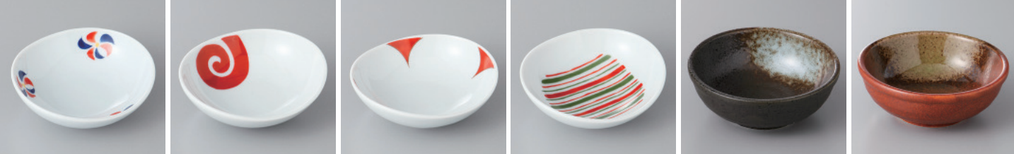
146-1-93H 520円 有田焼 錦風車精円小付 10入 8×7.5×2cm 50cc 146-2-93H 520円 有田焼 錦渦紋精円小付 10入 8×7.5×2cm 50cc 146-3-93H 520円 有田焼 錦四葉精円小付 10入 8×7.5×2cm 50cc 146-4-93H 520円 有田焼 錦十草精円小付 10入 8×7.5×2cm 50cc 146-5-78H 350円 白吹天目丸小付 9.2×3.5cm 146-6-27H 370円 織部備前2.8ボール 9.3×3.5cm