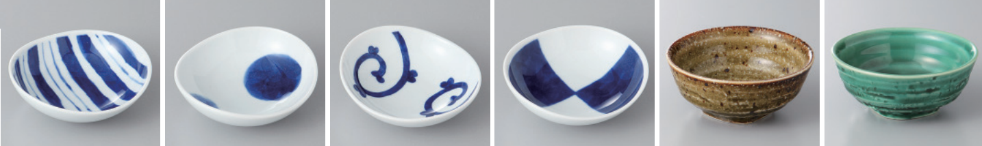
146-7-93H 400円 有田焼 縞十草精円小付 10入 8×7.5×2cm 50cc 146-8-93H 400円 有田焼 二色丸紋精円小付 10入 8×7.5×2cm 50cc 146-9-93H 400円 有田焼 唐草精円小付 10入 8×7.5×2cm 50cc 146-10-93H 400円 有田焼 市松精円小付 10入 8×7.5×2cm 50cc 146-11-43H 340円 唐津釉膳めく小付 8×3.4cm 146-12-43H 340円 織部釉膳めく小付 8×3.4cm