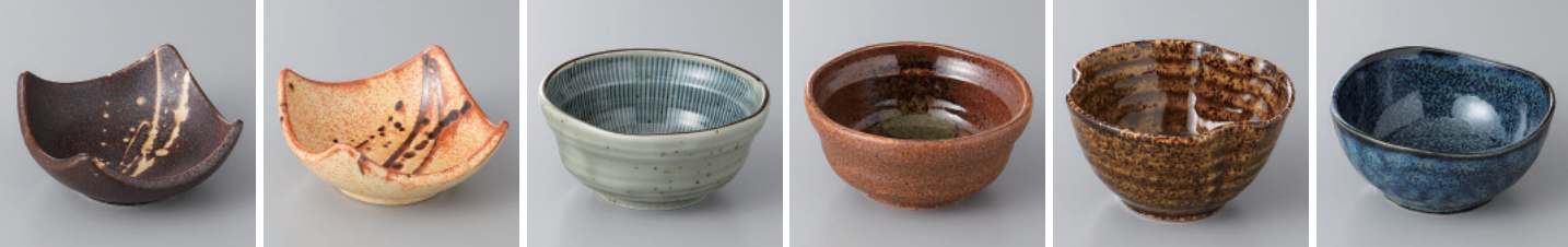
146-13-6H 350円 黒結晶四角小付 7.8×7.8×3.3cm 146-14-6H 350円 黄結晶四角小付 7.8×7.8×3.3cm 146-15-32H 350円 益子トクサダルマ型小鉢 9.4×4.2cm 146-16-32H 350円 伊賀ダルマ型小鉢 9.4×4.2cm 146-17-43H 350円 唐津珍味小鉢 8.2×4.6cm 146-18-32H 350円 窯変紺三角小鉢 140入 9×3.9cm