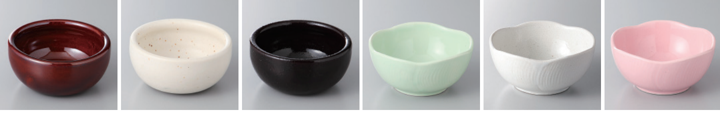
146-19-1H 340円 アメ釉厚口小付 8.1×4cm 146-20-1H 340円 白梨地厚口小付 8.1×4cm 146-21-1H 340円 天目厚口小付 8.1×4cm 146-22-79H 370円 梅型少々丼(ヒワ) 9×4cm 146-23-79H 370円 梅型少々丼(粉引) 9×4cm 146-24-79H 370円 梅型少々丼(ピンク) 9×4cm