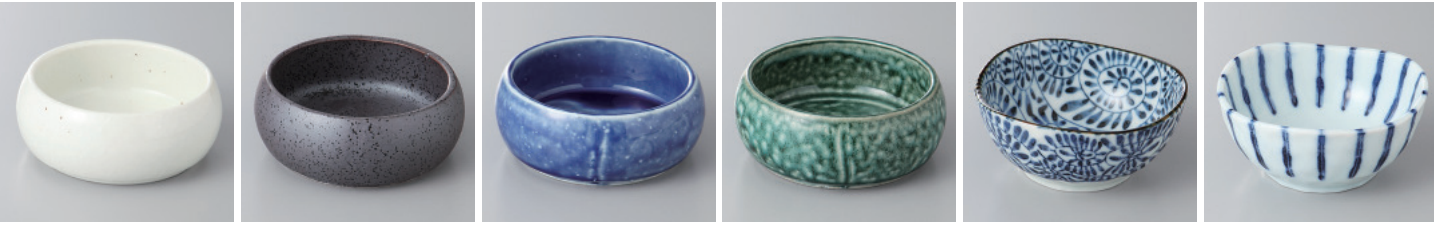
146-25-56H 330円 粉引重ね珍味 8.5×3.5cm 146-26-56H 330円 いぶし重ね珍味 8.5×3.5cm 146-27-56H 330円 ブルー重ね珍味 8.5×3.5cm 146-28-56H 330円 グリーン重ね珍味 8.5×3.5cm 146-29-32H 350円 藍染タコ唐草三角3.0小鉢 140入 9×4.1cm 146-30-32H 350円 濃十草三角3.0小鉢 140入 9×3.9cm