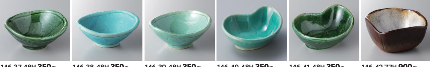
146-37-48H 350円 織部玉瀾小付 9.5×8.5×4cm 146-38-48H 350円 マットブルー玉瀾小付 9.5×8.5×4cm 146-39-48H 350円 トロコ玉瀾小付 9.5×8.5×4cm 146-40-48H 350円 トロコ空豆小付 9.5×7.5×4cm 146-41-48H 350円 織部空豆小付 9.5×7.5×4cm 146-42-77H 900円 備前志野角小鉢 9.2×5cm