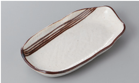
255-14-71H 850円 志野流線変形串皿 17.8×9.6×2cm