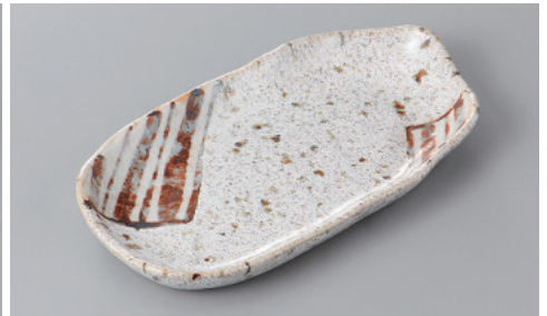
255-15-71H 850円 うのふストライプ変形串皿 17.8×9.6×2cm