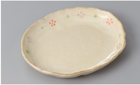
255-2-77H 1,100円 彫り小花小判6.0皿 17.8×14×2.5cm