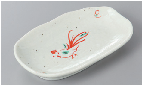
255-8-35H 950円 赤絵鳥椿円串皿 16.8×9.7×2.8cm