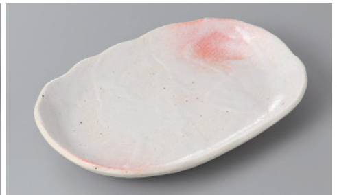
255-18-60H 650円 桜志野小判皿 21×13.5×2.5cm