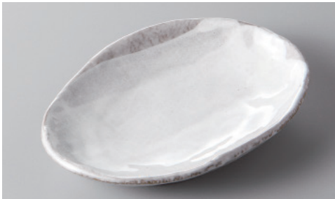
255-13-84H 980円 白刷毛目6.5号小判皿 19.5×14×4cm