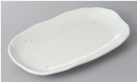
255-11-8H 900円 だえん千筋 焼物皿 白 22×12.5×2.5cm