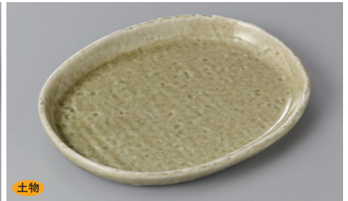
255-9-5H 990円 緑彩6.5小判皿 19.5×15×1.8cm