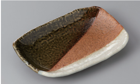
255-5-77H 1,020円 三色塗り分け7寸長角皿 20×13.3×2.8cm