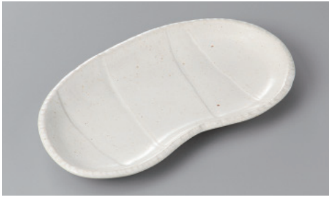
255-1-56H 1,250円 白釉そら豆焼物皿 22.7×12.5×2cm