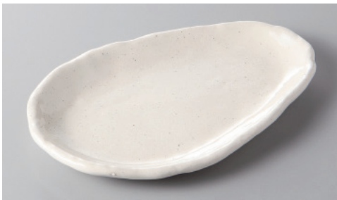
255-16-71H 680円 白粉引変形楕円皿 21.3×13.9×2cm