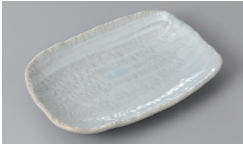
255-4-77H 1,020円 粉引ハケメ小判7.0皿 20×13.5×2.5cm