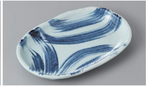
255-3-51H 1,050円 海流玉淵6.5小判皿 19.5×12.3×2.3cm