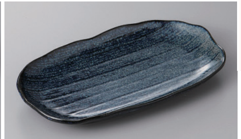
255-12-8H 900円 だえん千筋 焼物皿 藍の雪 22×12.5×2.5cm