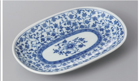
255-6-57H 980円 古伊万里唐草小判皿 18.7×12.8×2.3cm