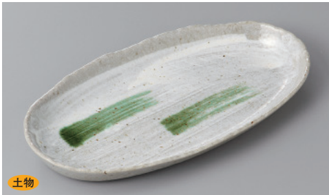
255-10-27H 1,100円 青磁オフケオリベ楕円皿 25.5×12.9×2.1cm