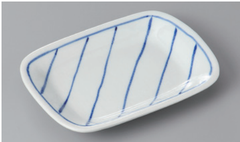
255-7-73H 970円 ストライプ小判皿 18.8×12.8×2.2cm