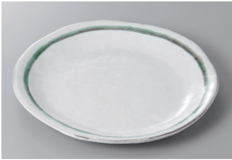
334-4-71H 2,900円 あおい7.5丸皿 23.5×2.5cm