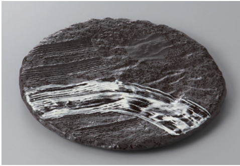
334-1-41H 3,000円 銀河三ツ足7.0皿 21×2.5cm