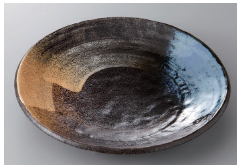
334-8-77H 1,180円 二色刷毛目手ひねり8.0寸皿 24×4cm