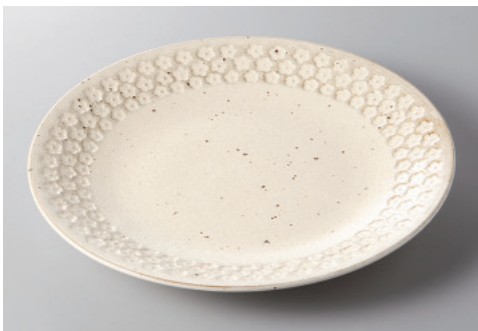
334-7-8H 1,400円 コットン印花型80皿 25.5×3cm