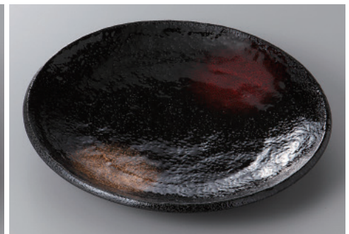
334-9-77H 1,340円 慶手捻り8寸皿 24×3.5cm