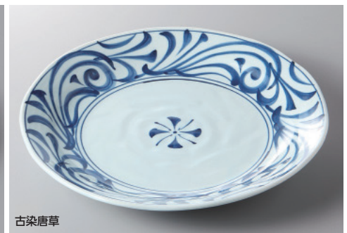
334-20-2H 2,300円 五寸皿 15.8×1.5cm