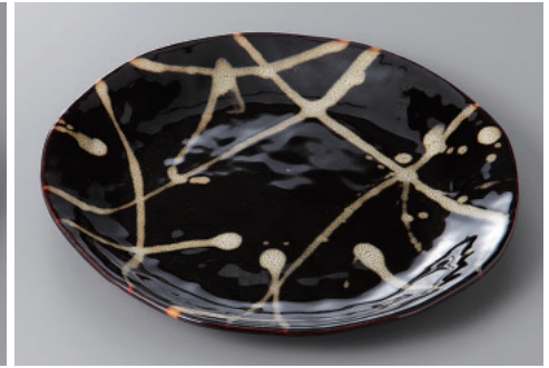
334-3-71H 2,750円 天目うのふ散し7.5皿 23.5×2.2cm