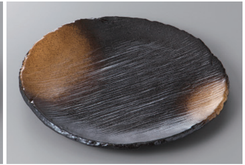
334-6-31H 2,300円 備前風金茶吹8.0丸皿 25.2×2.7cm