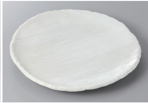
334-5-33H 2,200円 白河8.0丸皿 25×2.5cm