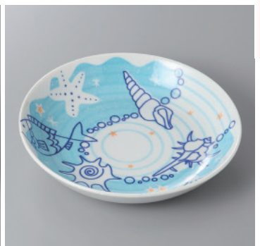
341-23-30H 500円 貝あわせ6.0深皿 19.5×3.8cm