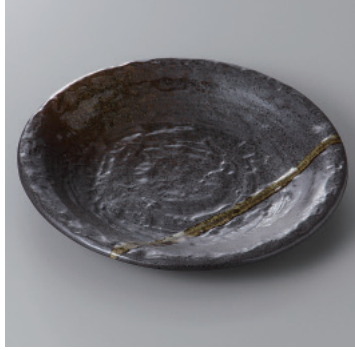
341-7-31H 1,100円 南蛮吹流し石目6.0皿 19.8×2.8cm