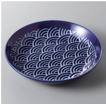
341-14-57H 1,000円 瑠璃なみ深口6.0皿 19.5×4cm