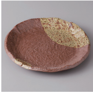
341-3-71H 1,300円 南蛮6.0丸皿 18.5×2cm