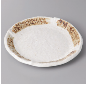
341-5-79H 1,200円 粉引茶刷毛目6.0丸皿 18.3×2.2cm