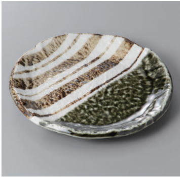
341-1-71H 1,350円 織部ストライプ6.0丸皿 18.3×2.3cm