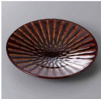
341-15-21H 840円 フォーカス ア×輪二重6.5皿 19.5×2.8cm