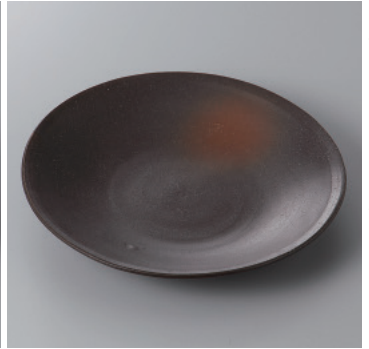
341-12-35H 970円 黒伊賀6.0丸皿 19.1×2.7cm