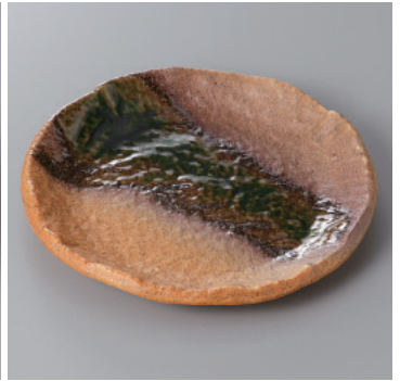
341-4-71H 1,300円 星雲伊賀6.0丸皿 18.6×2.2cm