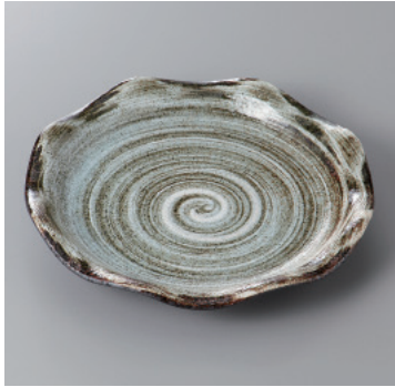
341-10-60H 1,000円 うず潮花型6.0皿 19×3cm