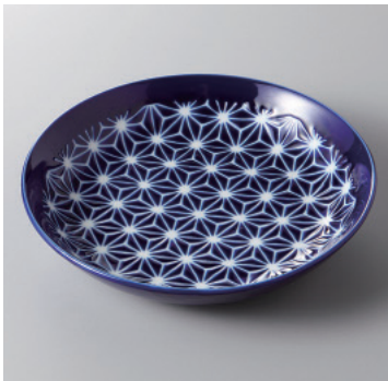
341-13-57H 1,000円 瑠璃麻深口6.0皿 19.5×4cm