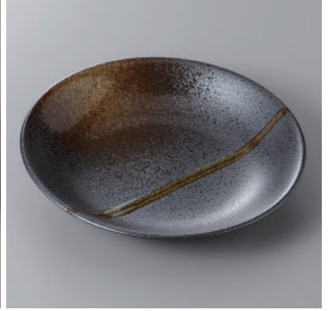
341-8-31H 1,200円 南蛮吹流し6.0皿 20.2×3.7cm