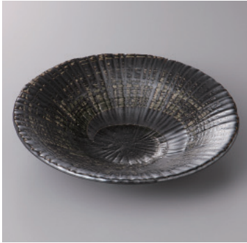
341-9-57H 1,100円 黒渦彫十草型平鉢 19.8×4.3cm