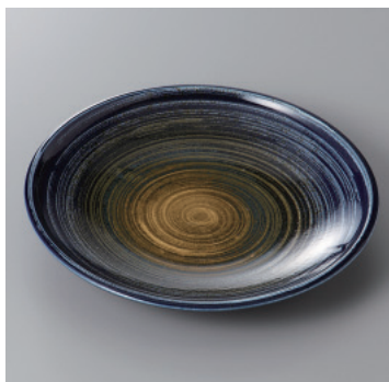
341-22-77H 740円 青風丸6寸皿 19.5×19.5×3cm