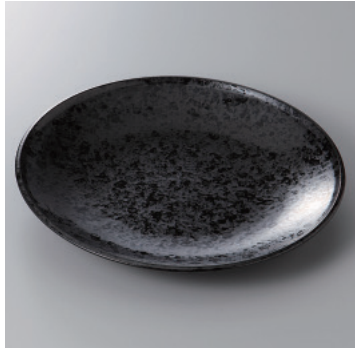
341-11-43H 1,000円 銀彩天目6.0皿 19.3×3cm