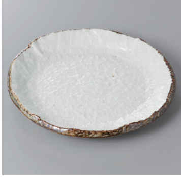
341-6-71H 1,300円 ソバ志野6.0丸皿 18×2.2cm