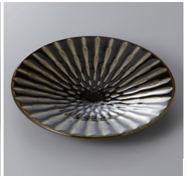
341-16-21H 840円 フォーカス 織部輪二重6.5皿 19.5×2.8cm