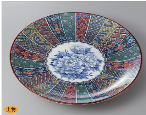
土物 393-8-81H 2,900円 染錦10号大皿 32×3cm