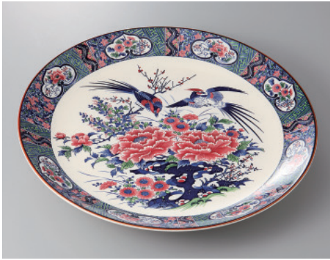
393-1-84H 6,700円 春日13号丸皿 42.5×5cm