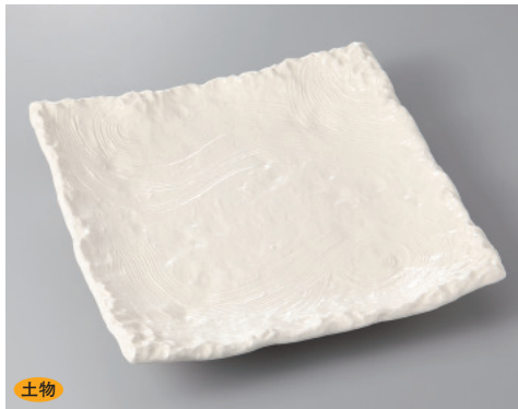
土物 393-5-81H 3,300円 白釉10号四ツ足正角皿 30.5×30.5×5.5cm