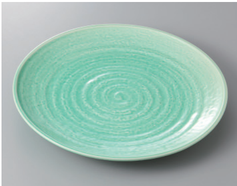
393-4-84H 3,400円 トルコ10号丸皿 30.3×3.3cm