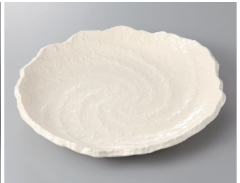
393-9-84H 2,600円 白地うず潮10号皿 31.3×27.2×4.6cm