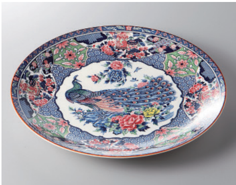
393-7-84H 2,900円 孔雀10号丸皿 32×3.5cm