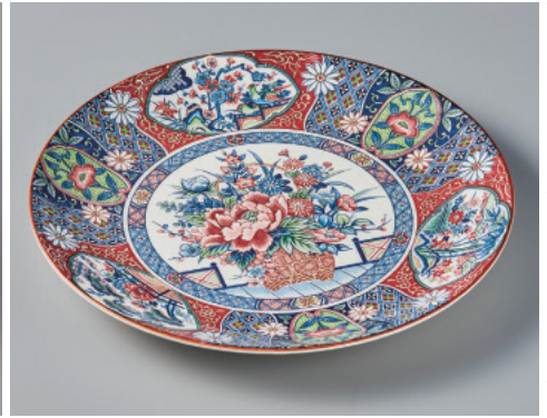
393-3-84H 2,900円 花かご10号丸皿 32×3.5cm