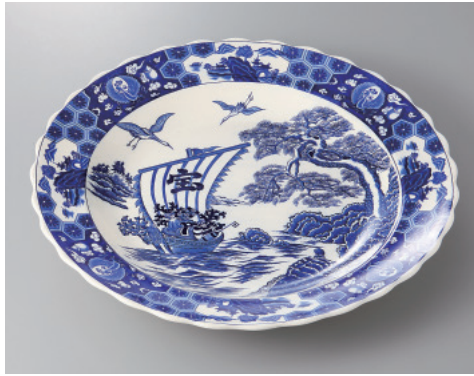
393-2-84H 6,000円 宝舟13号雪輪皿 41.5×5.5cm