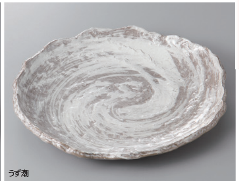
うず潮 393-14-84H 3,000円 10号皿 31×27×4.3cm 393-15-84H 1,900円 8号皿 24.8×21.8×3.8cm