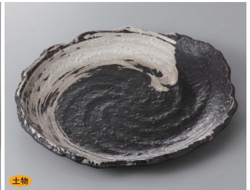
土物 393-6-81H 2,700円 白刷毛小判盛皿 30.5×26.5×3cm